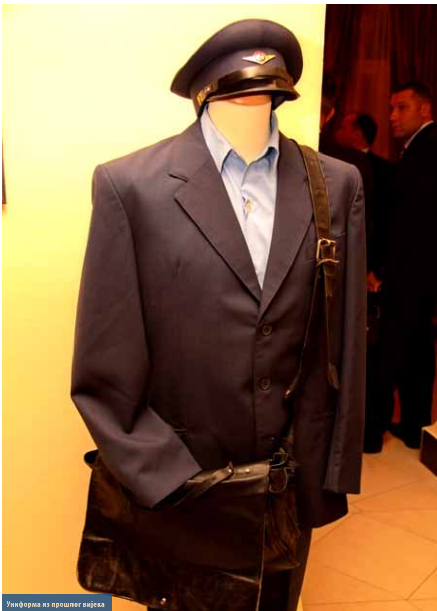
Униформа из прошлог вијека

уживале у музичком програму, за који је био задужен женски камерни хор „Бањалучанке“.