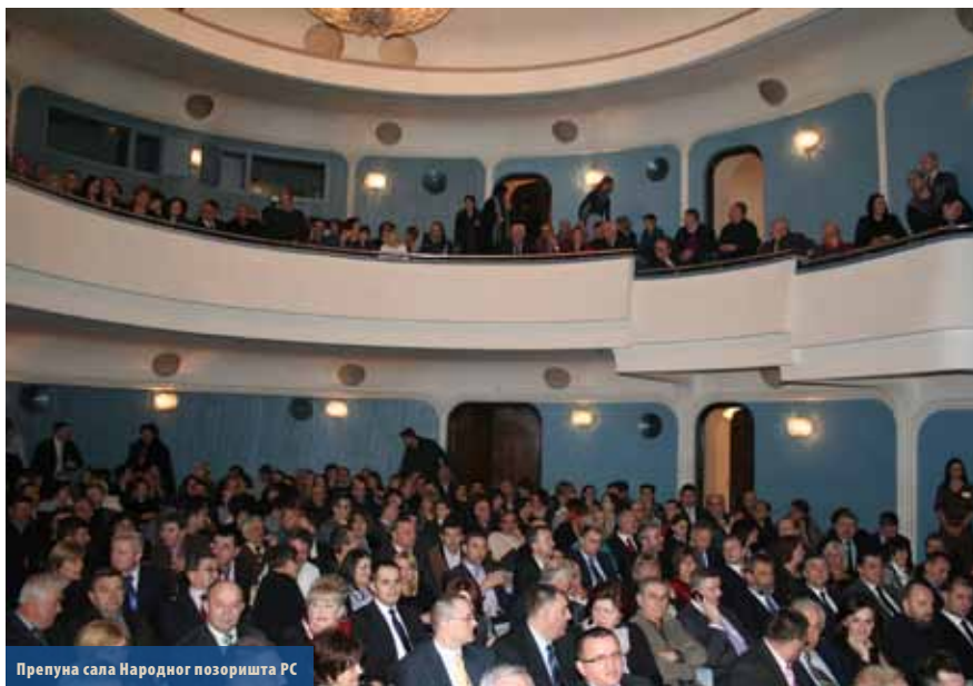
Препуна сала Народног позоришта РС

Поште Српске, петнаест година постојања и рада прославиле су пригодним свечаностима, уз присуство великог броја радника и званица. Истим поводом, издата је и пригодна поштанска марка „15 година Пошта Српске“.