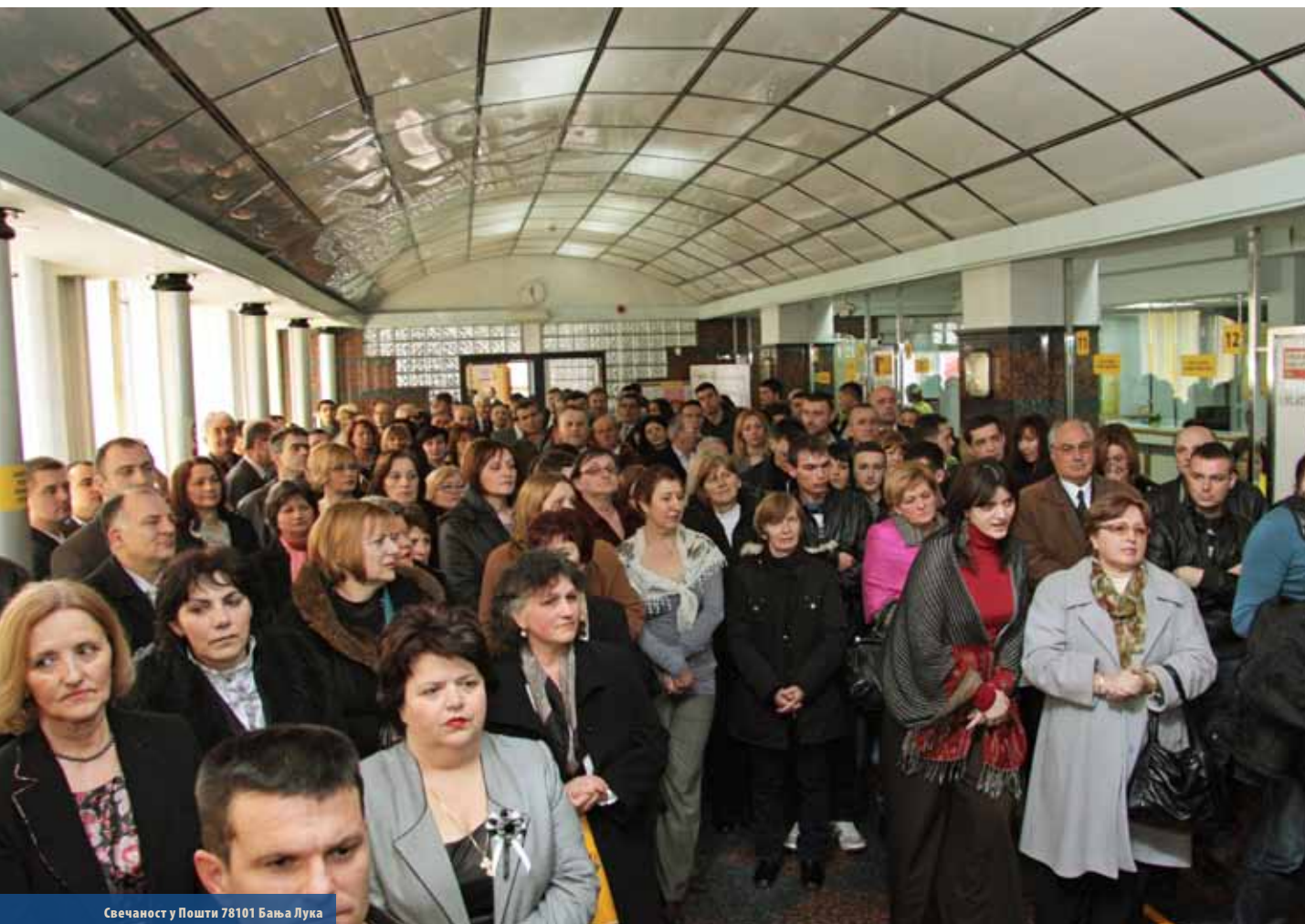
Свечаност у Пошти 78101 Бања Лука