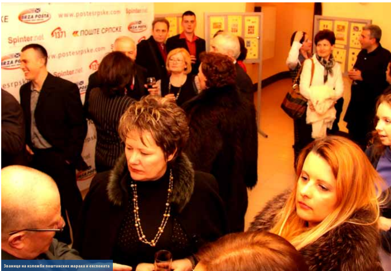
Званице на изложби поштанских марака и експоната