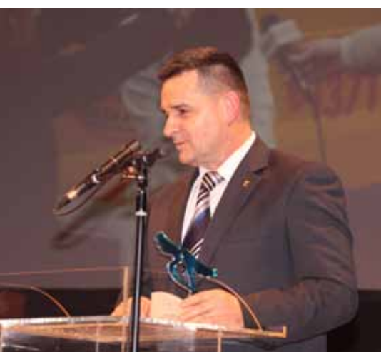
Гојко Васић , директор Полиције РС, „Добра сарадња између Полиције и Пошта ће се наставити и у будућности.“