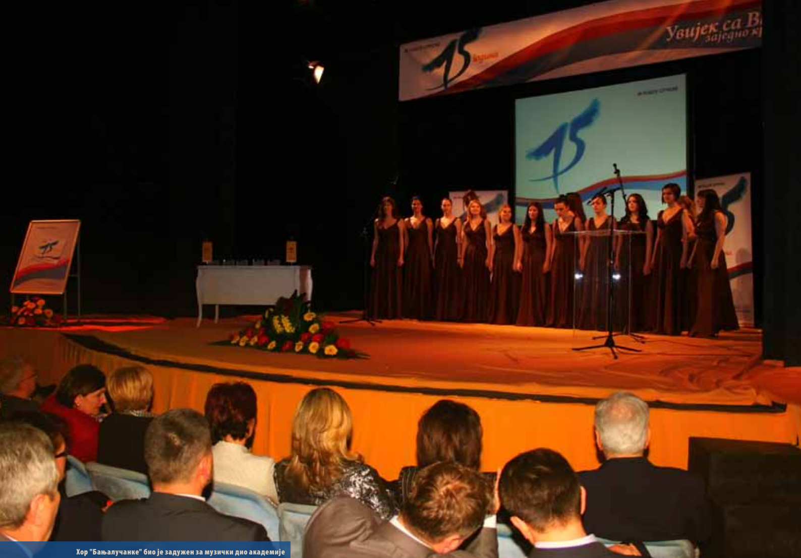
Хор "Бањалучанке" био је задужен за музички дио академије