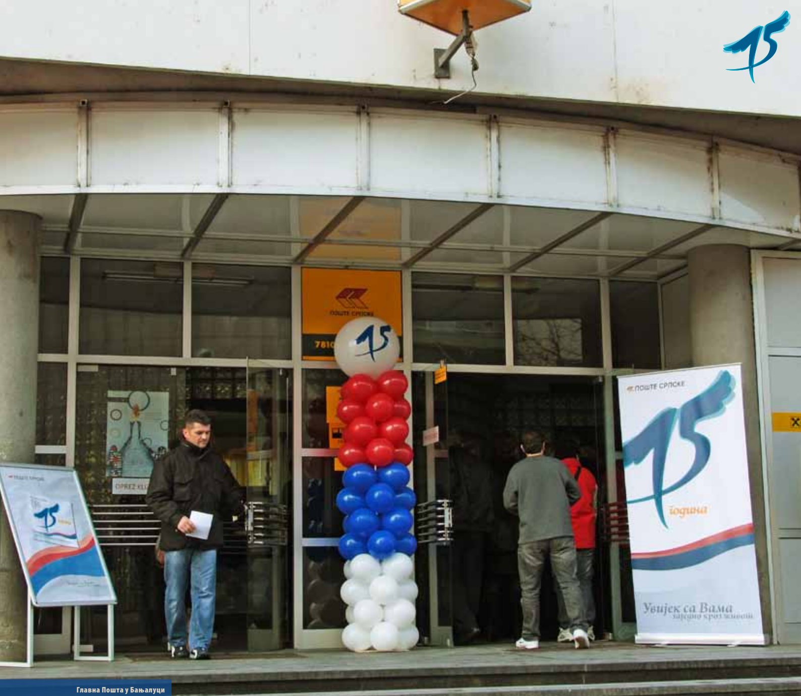
Главна Пошта у Бањалуци