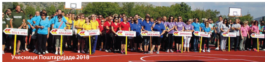
Учесници Поштаријаде 2018

Традиционално, у ведром и ентузијастичном расположењу, у Спортско-рекреативном комплексу „Град сунца“ у Требињу, преко 250 „поштара“, присуствовало је одржавању XV по реду Радничких-спортских игара „Поштаријада 2018“.