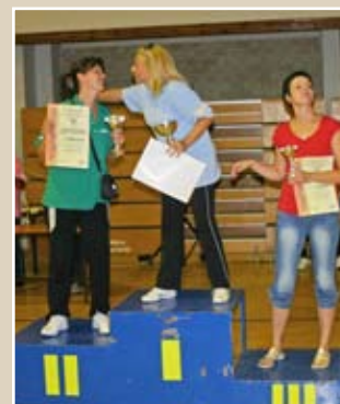
ОДБОЈКА НАГРАДЕ Екипни њласман