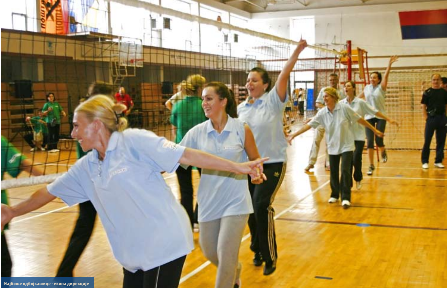
Најбоље одбојкашице - екипа дирекције