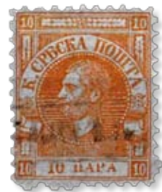
Србија 1866. - Михаило Обреновић 10 пара

У области филателије, највишу цијену достигло је писмо из периода аустријске окупације БиХ из 1894. године, које је продато по почетној цијени од 4.500 евра. Најскупље продата поштанска марка на аукцији је из 1868. године са ликом кнеза Михаила од једне паре. Ово је уједно и најрјеђа српска марка и постигла је цијену од 4.100 евра. Међу продатим филателистичким колекцијама издваја се збирка Краљевине Југославије, која је од почетних 1.500 евра достигла износ од 2.400 евра. Најскупља серија била је „велика Сента“ из 1944. године. То су марке Мађарске са претиском петокраке звезде и натписом Југославија, које је користио Народноослободилачки одбор града Сенте. Серија је продата за 1.500 евра, а почета цијена била је 950 евра. Што