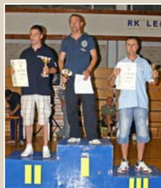
БРЗО ХОДАЊЕ НАГРАДЕ Екипни њласман