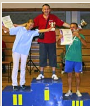
ПОТЕЗАЊЕ КОНОПЦА НАГРАДЕ Екипни њласман