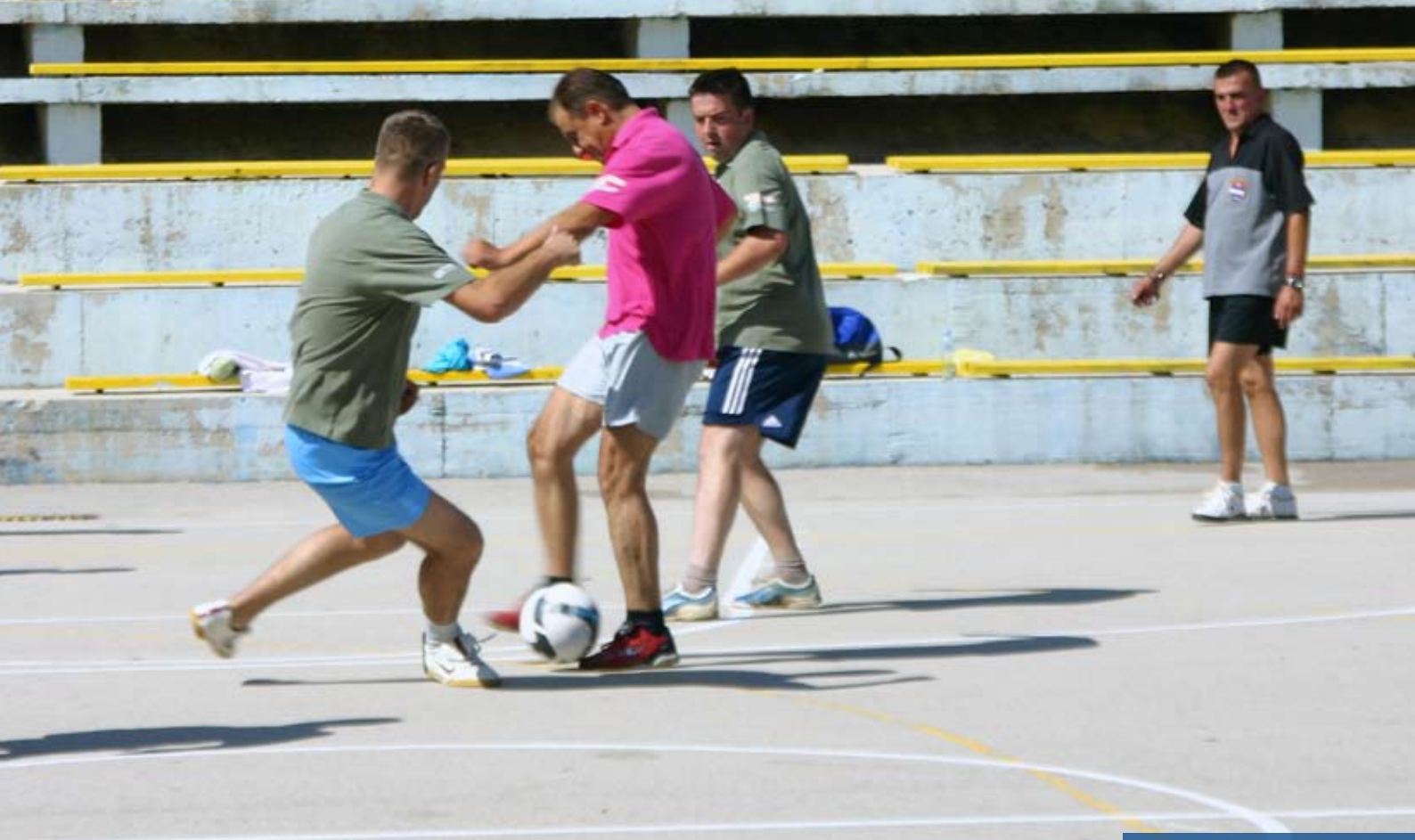
Фудбал: РЈ Соколац - РЈ Фоча

Осим женске екипе Требиња, изненађење су биле и нове боје мајица, тако да смо, ове године, осим стандардних боја, имали и модерну боју цикламе. Мајице у овој боји, додијељене су РЈ Соколац, што, како смо чули, и није баш одговарало мушкарцима, „гдје ћу ја носити ову боју...“ Ех! Ко ће свима угодити!