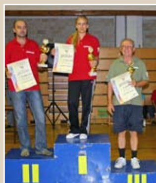
НАЈБОЉЕ ПЛАСИРАНА РЈ НАГРАДЕ Екипни њласман