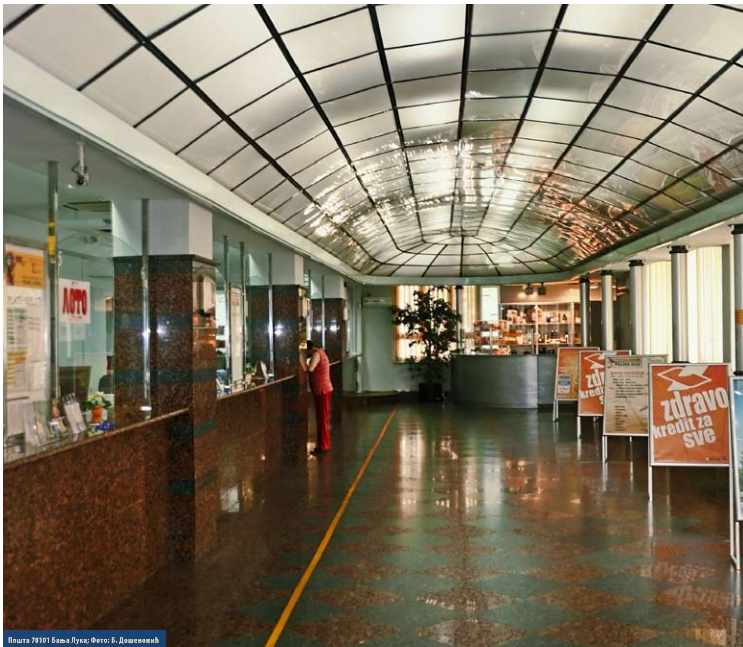
Пошта 78101 Бања Лука; Фото: Б. Дошенић