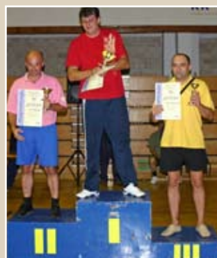
СТРЕЉАШТВО НАГРАДЕ Екипни њласман