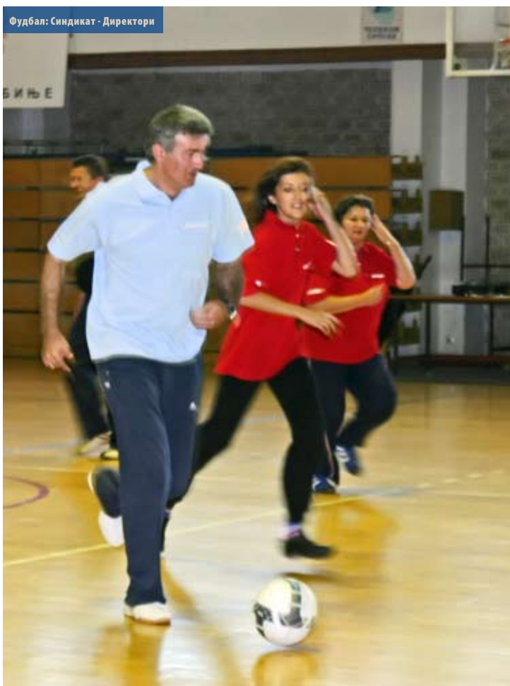
Фудбал: Синдикат - Директори