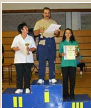
СТОНИ ТЕНИС НАГРАДЕ Екипни њласман