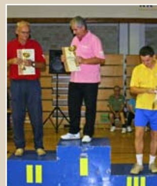
ШАХ НАГРАДЕ Екипни њласман