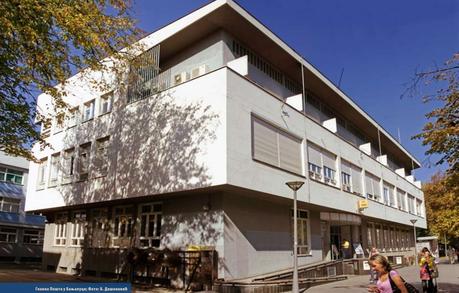
Главна Пошта у Бањалуци

процјени, у 2008. години, оствариле позитиван пословни резултат од 7.336.99 КМ, који произилази из: