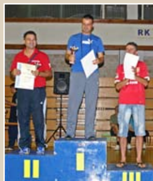
ФУДБАЛ НАГРАДЕ Екипни њласман