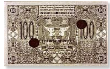
100 перпера 1912.

се тиче карата и разгледница ту су биле двије антимасонске пропагандне карте из 1941. године, које су продате по цени од 920 евра свака, а њихова почетна цена износила је свега по 190 евра. Што се тиче ордења, највишу цијену је достигао орден народног хероја – 1.500 евра, а орден југословенске звијезде првог реда продат је за 1.300 евра, иако му је почетна цијена била 900 евра.