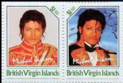
Издање из 80-тих година прошлог вијека „Краљ попа“