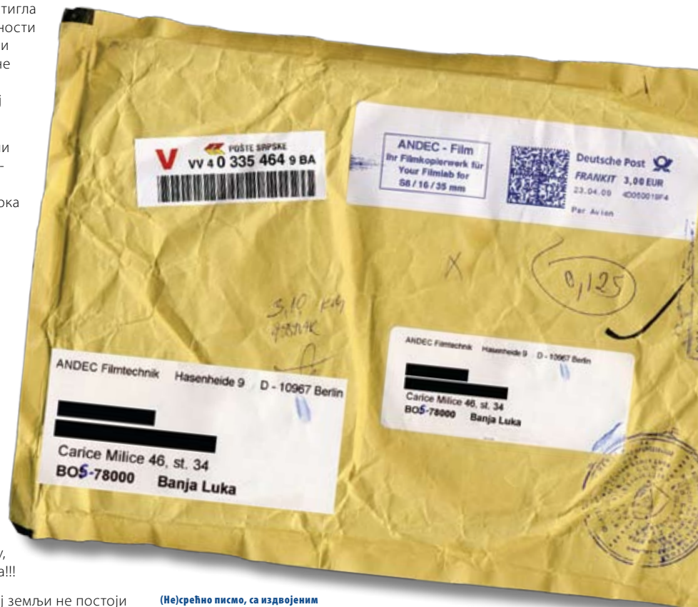
(Не)срећно писмо, са издвојеним адресним дијелом који су кориговали поштари у Боливији