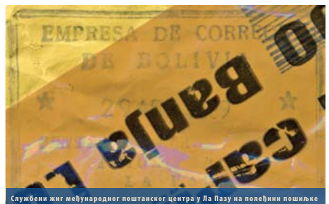
Службени жиг међународног поштанског центра у Ла Пазу на полеђини пошиљке