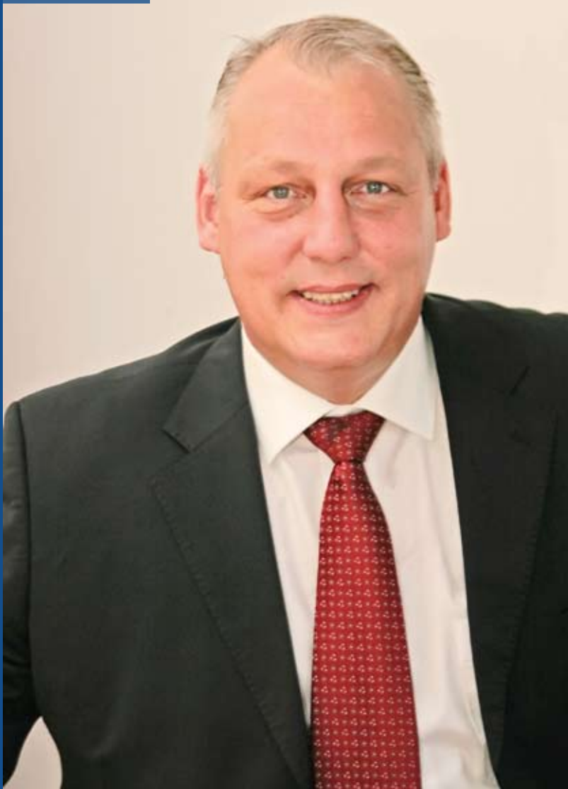
ФОТО: Божидар Дошеновић